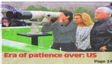
Era of patience over: US