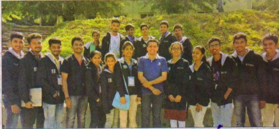
ಪ್ರಶಸ್ತಿ ವಿಜೇತ ವಿದ್ಯಾರ್ಥಿಗಳ ತಂಡ.

ಆದ್ಯಾರ್, ಎ. 17: ಸಹ್ಯಾದ್ರಿ ಕಾಲೇಜ್ ಆಫ್ ಎಂಜಿನಿಯರಿಂಗ್ ಆಂಡ್ ಮ್ಯಾನೇಜ್‌ಮೆಂಟ್‌ನ ಮೊದಲ ವರ್ಷದ ಎಂಜಿನಿಯರಿಂಗ್‌ನ 18 ವಿದ್ಯಾರ್ಥಿಗಳ ತಂಡ (ಮರಾಠಿ) ಹಿಮಾಚಲ ಪ್ರದೇಶದ ಮಂಡಿಯಲ್ಲಿರುವ ಭಾರತೀಯ ತಂತ್ರಜ್ಞಾನ ಸಂಸ್ಥೆ (ಎನ್‌ಐಟಿ)ಯಲ್ಲಿ ಜರಗಿದ ಮೂರು ದಿನಗಳ ರಾಷ್ಟ್ರೀಯ ಮಟ್ಟದ ತಾಂತ್ರಿಕ ಕಾರ್ಯಕ್ರಮ ಎಕ್ಸ್‌ಪ್ಲೋಡಿವ್-2017ರಲ್ಲಿ ಭಾಗವಹಿಸಿ ಪ್ರಶಸ್ತಿ ಗೆದ್ದಿದ್ದಾರೆ.